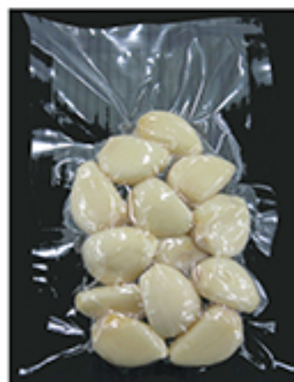
用途に合わせ内容量は ご要望にお応えいたします。