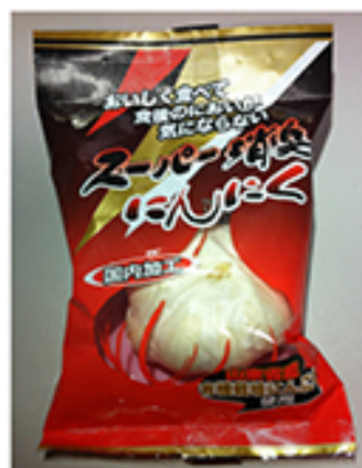
スーパー消臭にんにく 内容量 1 玉